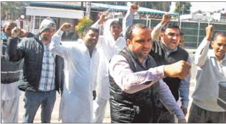
चंडीगढ़। मुख्यमंत्री से मिलने से पहल नारेबाजी करते जाट समाज के लोग।