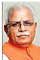
भाईचारा नहीं टूटने दूंगा: मुख्यमंत्री ने स्पष्ट किया कि सरकार सामाजिक एवं शैक्षणिक रूप से हर पिछड़े वर्ग के व्यक्ति के साथ हमेशा खड़ी हुई है, भले ही वो किसी भी समुदाय का क्यों नहीं हो? उन्होंने कहा कि वे कभी भी प्रदेश में आपसी भाईचारा नहीं टूटने देंगे। उन्होंने कहा कि मुद्दों को समझना एवं प्रदेश में शांति बनाए रखना सभी की जिम्मेवारी है। प्रदेश की अदार्थ करोड़ जनसंख्या को वे अपना परिवार मानते हैं। मुख्यमंत्री ने कहा कि जाति समुदाय और राजनीति से ऊपर उठकर 'सबका साथ-सबका विकास' सरकार का लक्ष्य है।